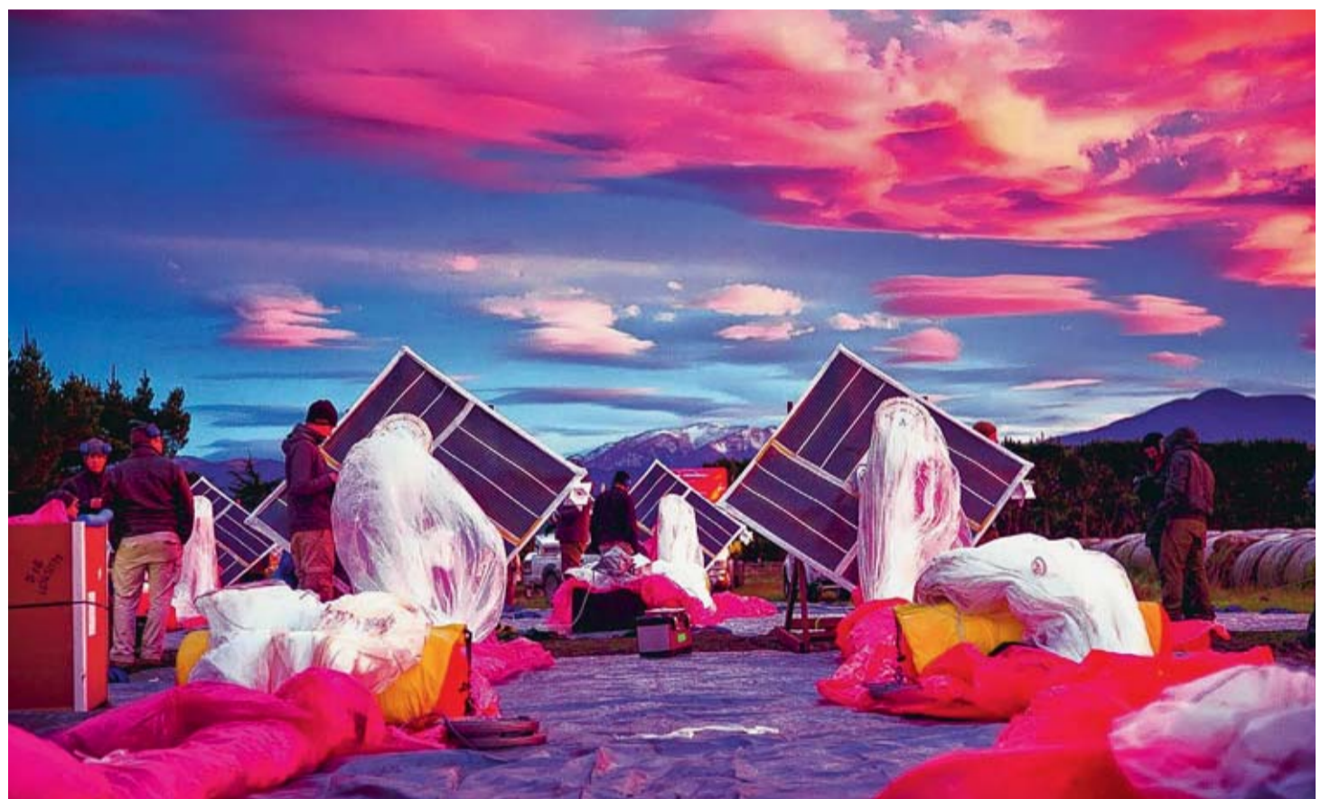
Depuis la semaine dernière, une trentaine de ballons flottent à une vingtaine de km d'altitude au-dessus de la Nouvelle-Zélande.

TECHNIQUE Le procédé testé par Google permettra d'atteindre des zones difficiles d'accès